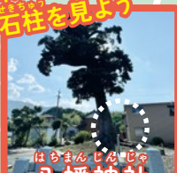
はちまん じんじや 八幡神社