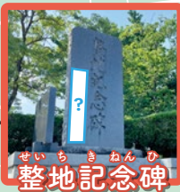
せいち きねんび 整地記念碑