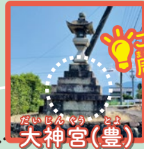
おぐに じんぐう 大神宮(豊)