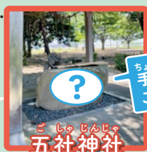
ごしゅ じんじや 五社神社