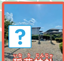
いなり じんじや 稲荷神社