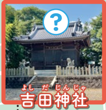
よしだ じんじや 吉田神社