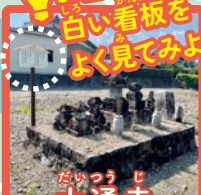
だいじゅう じ 大通寺