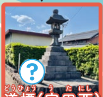
どうびょう (うたにし) 道標(宇田西)