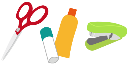
はさみ、のり、ホッチキス