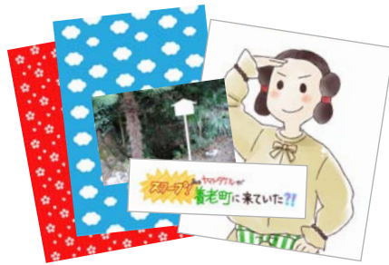
印刷した雑誌キット、自分で描いたイラスト・写真など